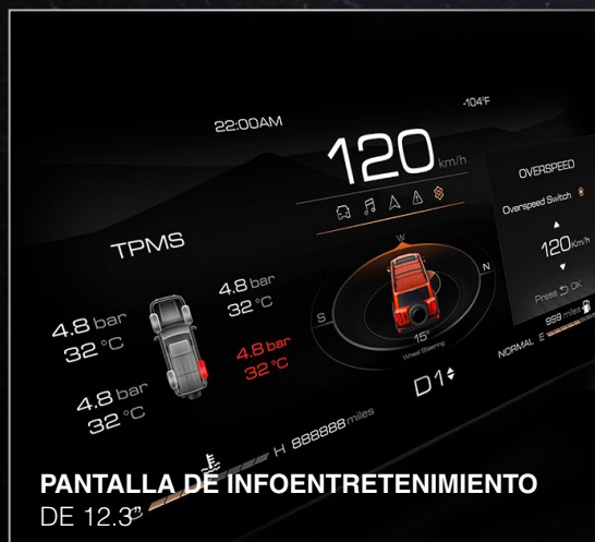
PANTALLA DE INFOENTRETENIMIENTO DE 12.3"